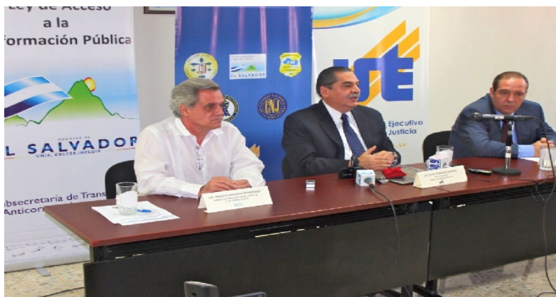
Conferencia de prensa realizada para anunciar el lanzamiento de la campaña divulgativa de la LAIP y firma de Convenio UTE - SAE

En el marco de este Convenio y como parte de las actividades propuestas para la promoción y divulgación de la LAIP, así como para la generación de la cultura de transparencia, tanto a nivel de administración pública como de ciudadanía, con el apoyo técnico y financiero de la Agencia Española de Cooperación Internacional para el Desarrollo (AECID), se trabajó en coordinación con la SSTA en la elaboración de cinco spots informativos de la LAIP, los cuales fueron producidos con la técnica de animación tipográfica - motion type-, para ser utilizados en redes sociales, televisión y cuñas radiales.