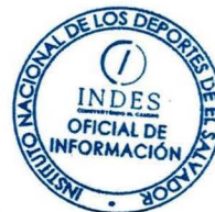
Lic. Carlos Eduardo Ceceña Grande Oficial de Información Instituto Nacional de los Deportes de El Salvador