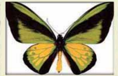
Ministerio del Medio Ambiente de Canadá