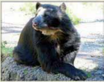
Oso andino de anteojos ( Tremarctos ornatus ) (Apéndice I)