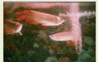
Asian bonytongue Scleropages formosus (Apéndice I)