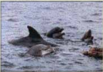
Delfin mular ( Tursiops truncatus ) (Apéndice II)