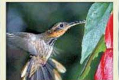
Ermitaño picosierra ( Ramphodon naevius ) (Apéndice II)