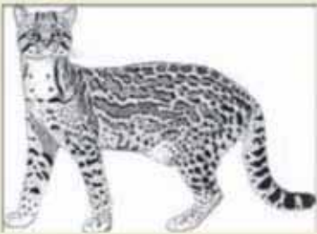
Ocelote ( Leopardus pardalis ) (Apéndice I)

Manual de identificación de especies CITES