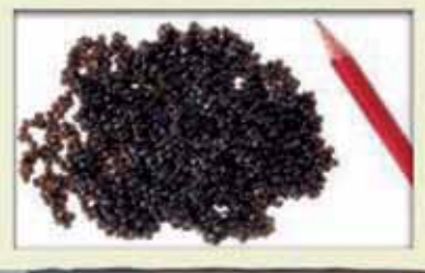
Sturgeon eggs (caviar) Acipenser sp (Apéndice I or II)