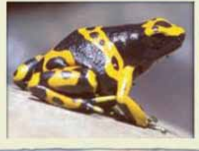
Yellow-banded poison frog Dendrobates leucomelas (Apéndice II)