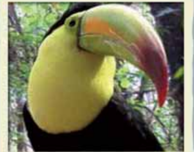
Tucán pico-multicolor Ramphastos sulfuratus (Apéndice II)

Instrumentos para el Control del Comercio y Tráfico de Fauna y Flora Silvestre en el Corredor Biológico Mesoamericano