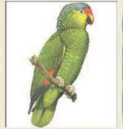
Loro cachete amarillo Amazona autumnalis (Apéndice II)

Manual de identificación de especies CITES