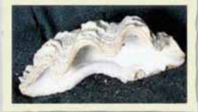
A. Bujold, SCF