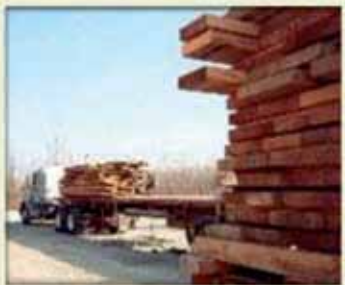
Y. Raymond, SCF