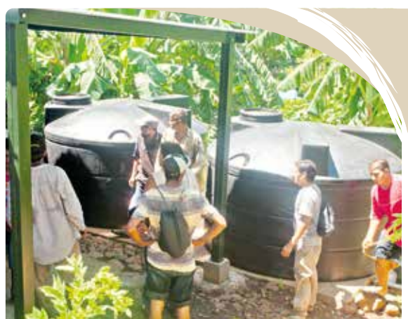
INSTALACIÓN DE TANQUES DE 5M³ EN EL CASERÍO LA PERIQUERA, ISLA DE MEANGUERA DEL GOLFO, LA UNIÓN.