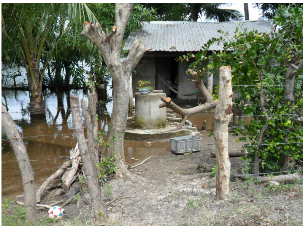
Figura 3: Vivienda en zona de inundación en la comunidad Las Hojas en el municipio de San Pedro Masahuat.