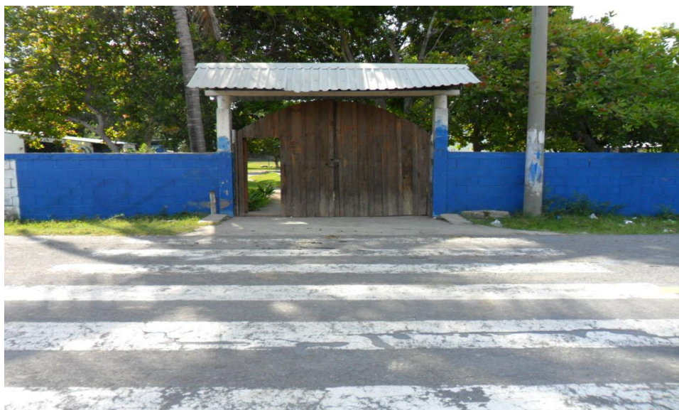
Figura 2: Centro Escolar Cantón Las Hojas en el municipio de San Pedro Masahuat.