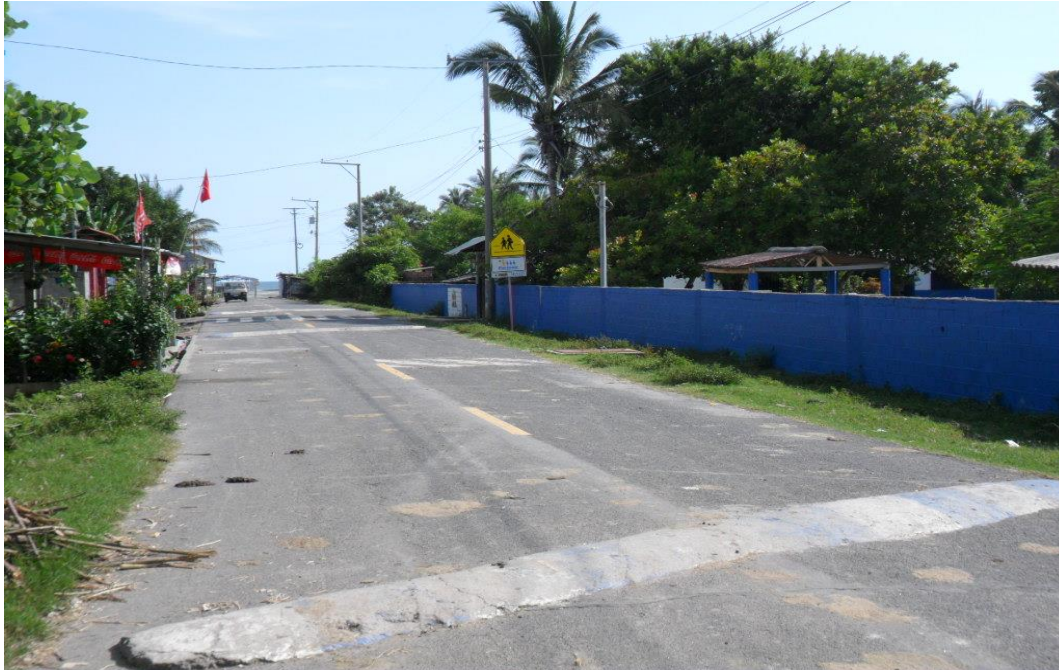
Figura 1: Entrada principal a la comunidad Las Hojas en el municipio de San Pedro Masahuat.

La calle de acceso principal al cantón Las Hojas viene desde la autopista de Comalapa aproximadamente a 10 km, pasando por las comunidades de Zalamar, Via Palestina, Astorias, San José de Luna, El Achiotal, Santamaría El Coyol.