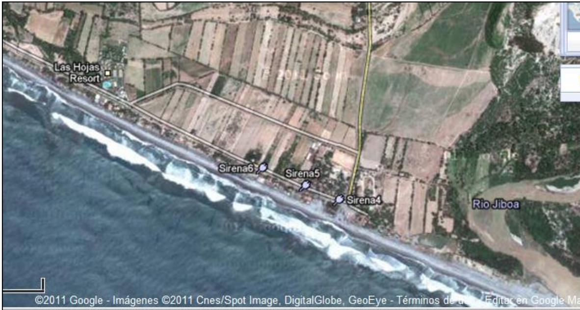
Figura 4: Vista satelital de la comunidad Las Hojas en el municipio de San Pedro Masahuat.