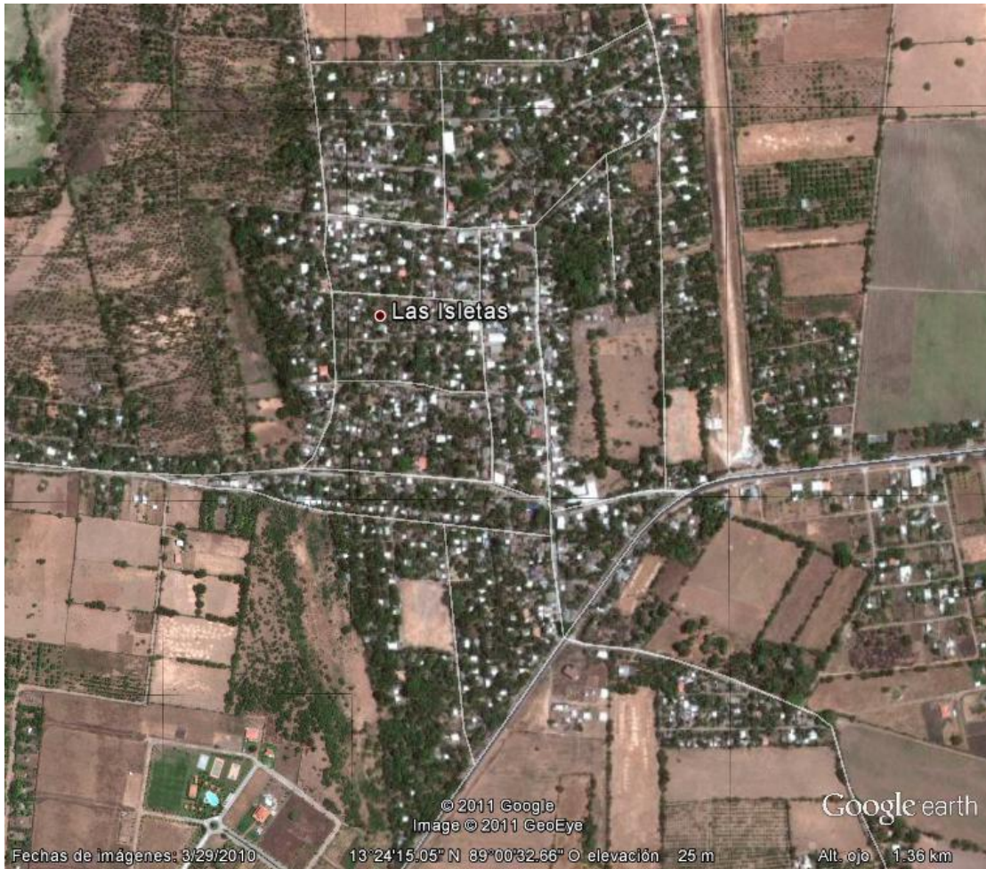
Figura 6: Imagen satelital de la comunidad “Las Isletas Centro”.