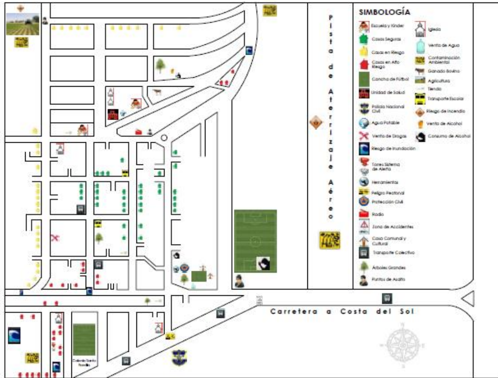
MAPA DE RIESGOS Y RECURSOS DE LA COMUNIDAD LAS ISLETAS [CENTRO] MUNICIPIO DE SAN PEDRO MASAHUAT