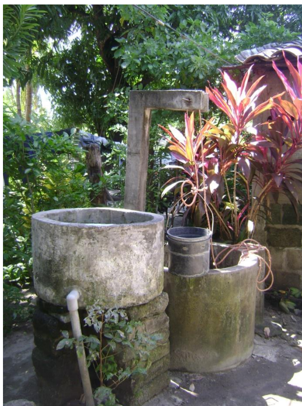
Figura 3: Pozo artesanal ubicado en una vivienda de la comunidad Las Isletas.