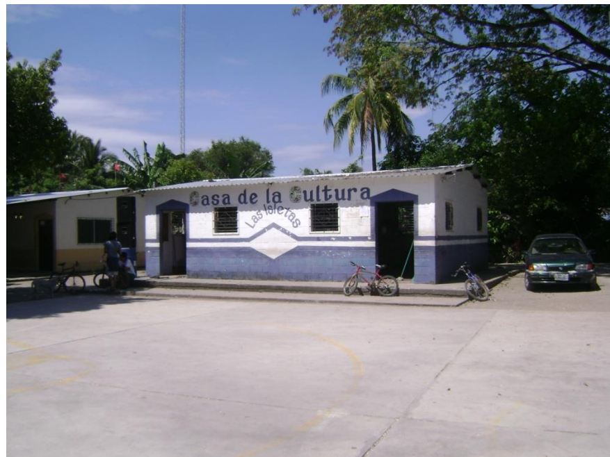
Figura 5: Casa de la cultura ubicada en la comunidad Las Isletas Centro