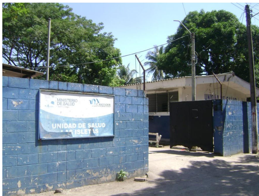
Figura 2: Vista principal de la unidad de salud Las Isletas.

En la unidad de salud se ofrecen servicios de odontología, medicina general, control de mujeres embarazadas y de niños, hay también un servicio de farmacia con medicamentos básicos para atención inmediata. Dentro de la unidad de salud se encuentra una doctora y un doctor, estos en ocasiones realizan turnos simultáneamente o en algunos momentos turnos diferentes, con el objetivo de facilitar el servicio a las personas de la comunidad. Las enfermedades o padecimientos que con mayor frecuencia son atendidas en la unidad de salud son gripes, calenturas, dolores de cabeza, dolores de estomago; la gran mayoría de estos padecimientos son infecciones debidas a faltas de condiciones de higiene en las viviendas y familias.