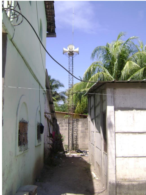
Figura 4: Torre de alerta temprana ubicada en la comunidad.