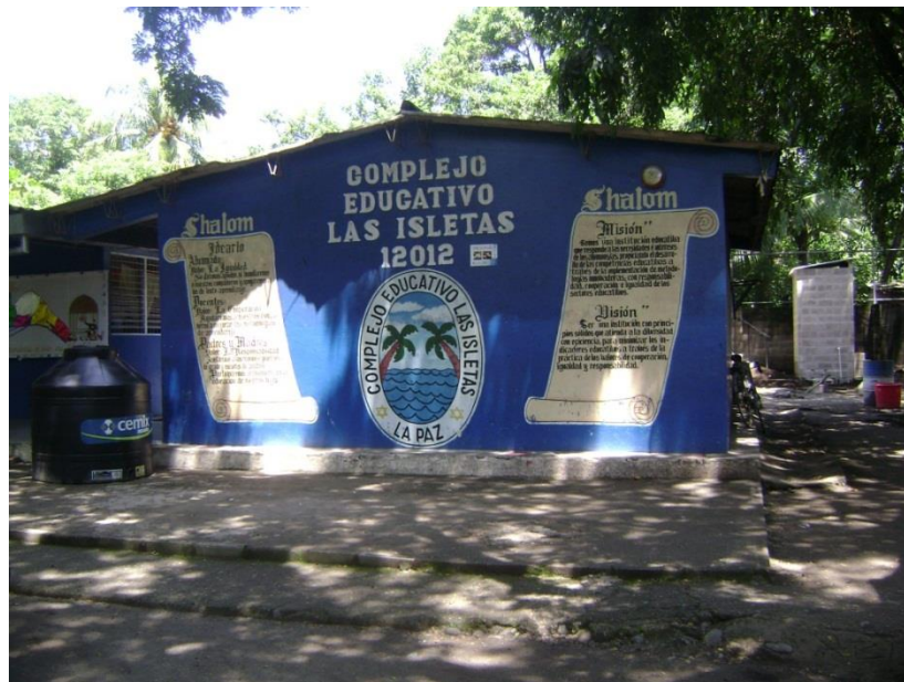
Figura 1: Complejo educativo “Las Isletas”, al cual asisten la mayoría de los niños y niñas de la comunidad “Las Isletas”.