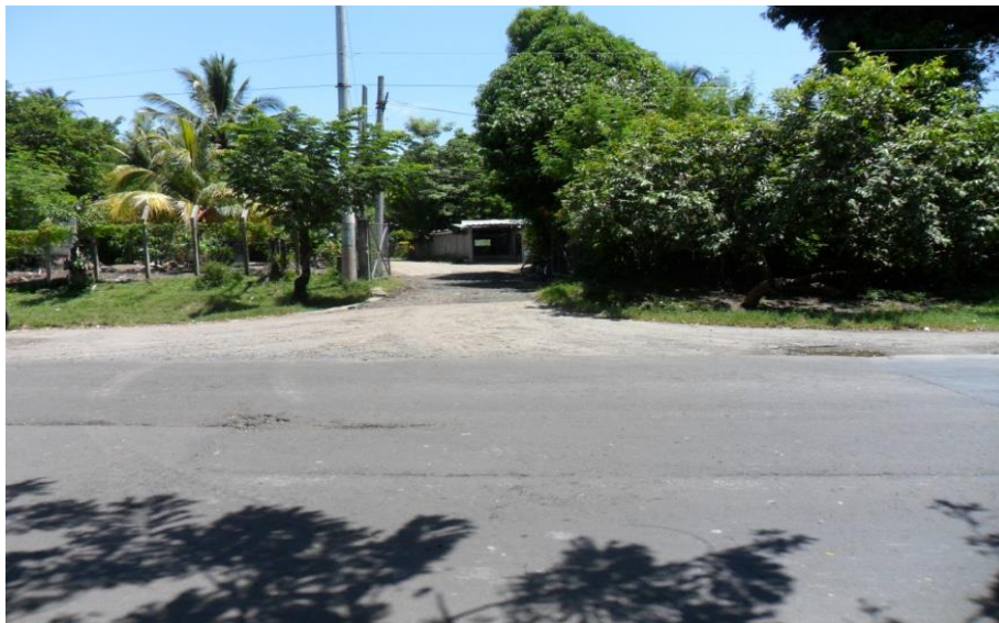
Figura1: Entrada principal al caserío Tres Ceibas, sobre el kilómetro 55 en la carretera que conduce a la playa Costa del Sol.

En el caserío Tres Ceibas existe únicamente una entrada principal que se encuentra a la altura del kilómetro 55 en la carretera que conduce a la playa Costa del Sol.