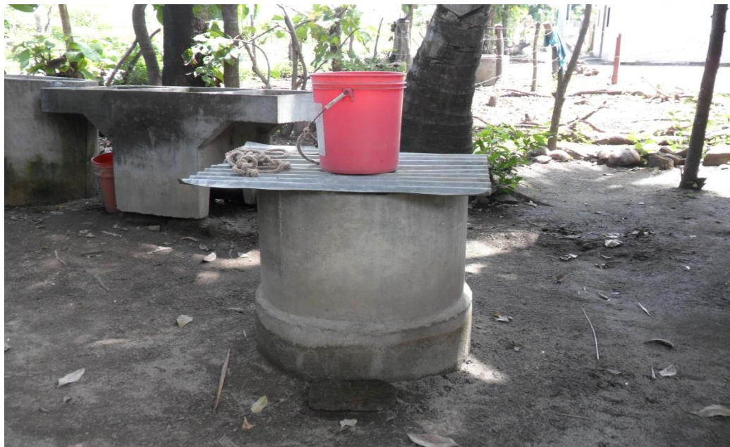
Figura 2: Pozos artesanales que abastecen de agua no tratada al caserío Tres Ceibas.