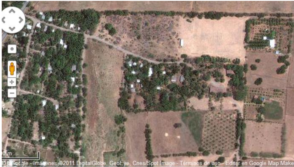
Figura 4: Vista satelital del caserío Tres Ceibas.