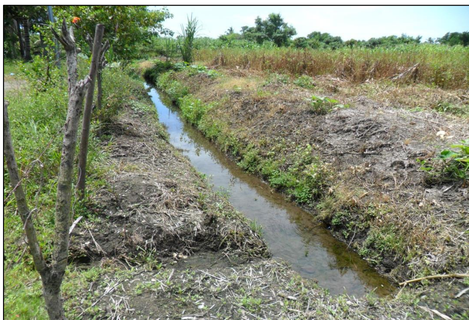
Figura 3. Cañada que se satura de agua en tiempos de lluvias en el caserío Tres

La comunidad se encuentra ubicada en un relieve de llanura costera, dada su relativa cercanía a la zona costera de la Paz; también se encuentra en las cercanías de la cañada Santa Emilia.