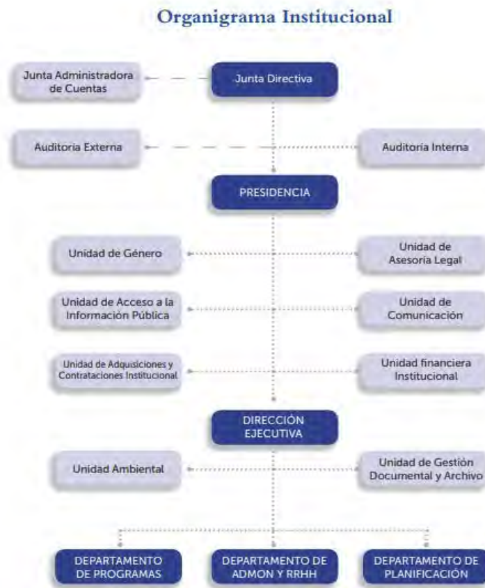
Figura 1. Diagrama Institucional vigente

Por otro lado, la Junta Directiva de FONAES actualmente está integrada por miembros designados por Ministerio de Agricultura, Ministerio de Medio Ambiente y Recursos Naturales, Ministerio de Salud y por Instituto Salvadoreño de Desarrollo Municipal, todos los miembros designados deberán contar con un suplente. Es importante mencionar que han sido 7 hombres asignados y 1 mujer.