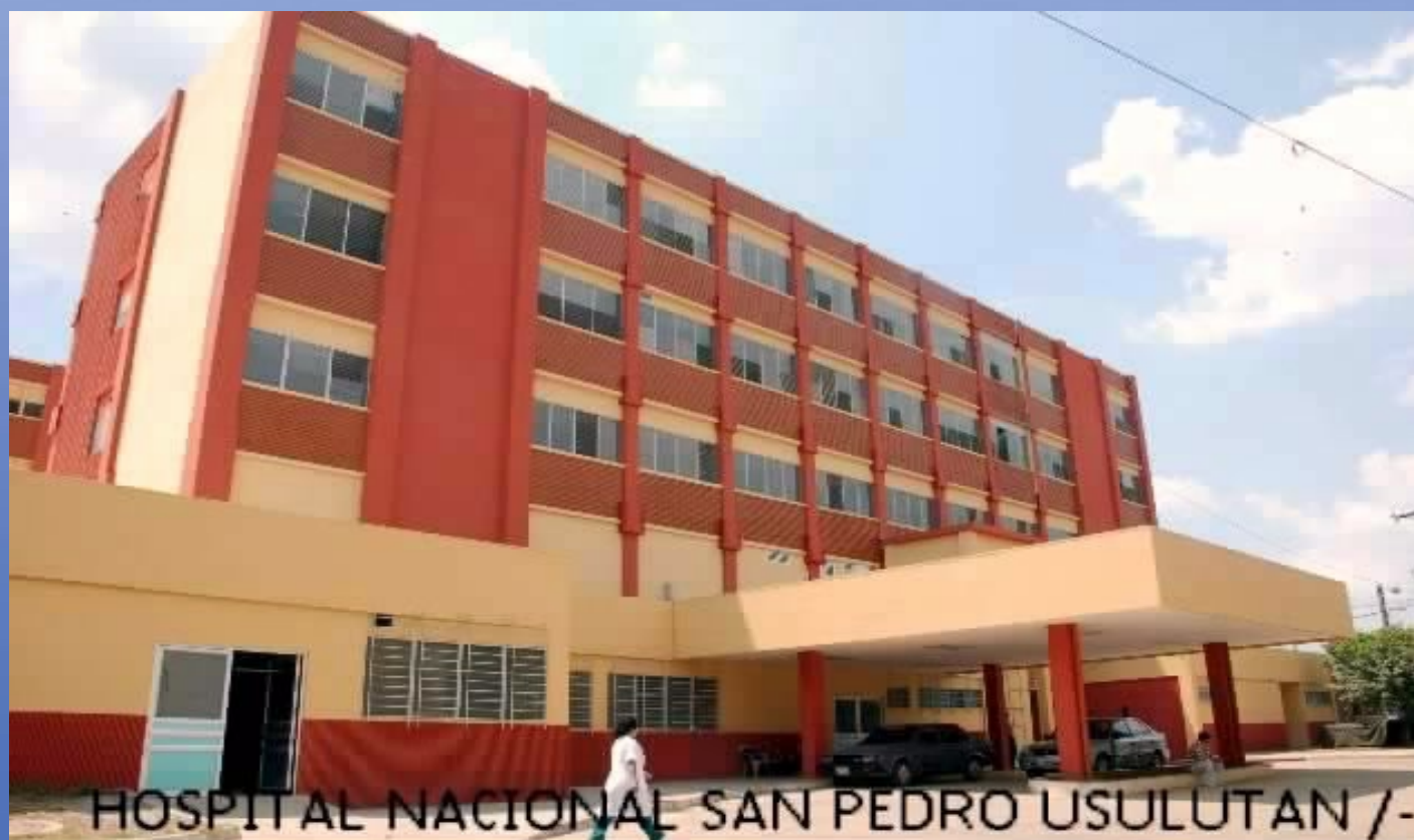
HOSPITAL NACIONAL SAN PEDRO USULUTAN /-