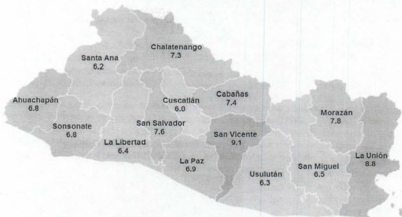
Mapa 4.1 El Salvador: Tasa de desempleo por departamento EHPM 2017

Desde una óptica territorial se observa que la tasa de desempleo se comporta de manera distinta entre los departamentos. Por ejemplo, los dos departamentos con la tasa de desempleo más bajas son Cuscatlán (6.0%), Santa Ana (6.2%). Mientras que los dos departamentos con mayor tasa de desempleo son San Vicente (9.1%), y La Unión (8.8%).