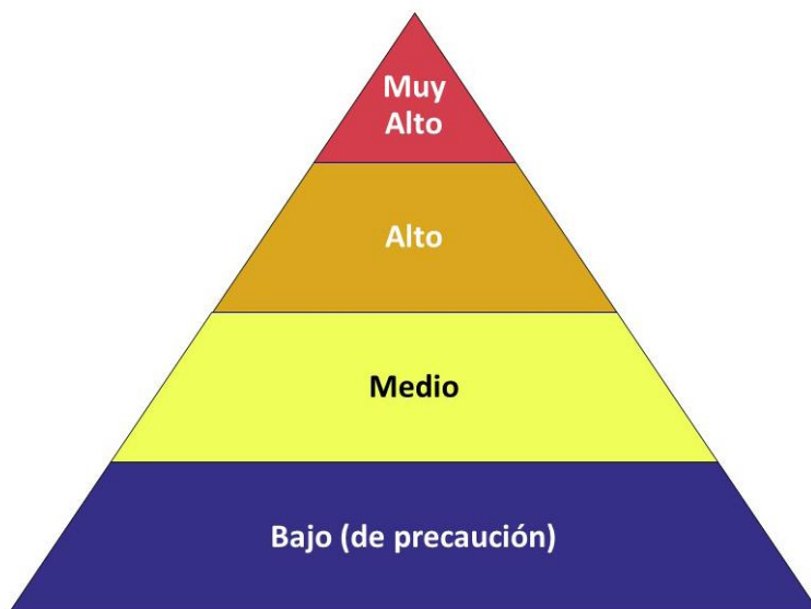
Figura G.1 - Pirámide de riesgo ocupacional para el COVID-19

La pirámide de riesgo ocupacional muestra los cuatro niveles de exposición al riesgo en la forma de una pirámide para representar la distribución probable del riesgo.