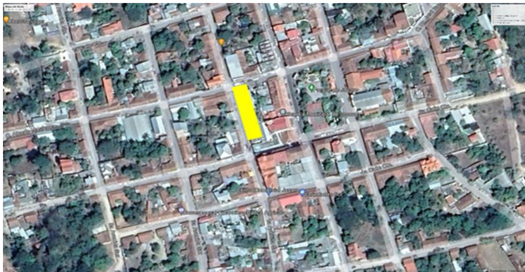
Imagen 1: esquema de ubicación

Coordenadas geodésicas del terreno: 13°36'44.13" N, 88°01'32.46" O