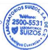
APODERADO ADMINISTRATIVO ESPECIAL DE LA SOCIEDAD LABORATORIOS SUIZOS, S.A. DE C.V.