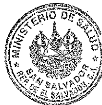
DRA. ELVIA VIOLETA MENJIVAR ESCALANTE MINISTRA DE SALUD