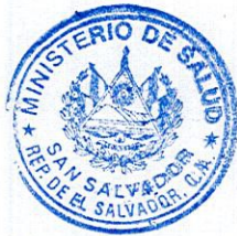
MARÍA ISABEL RODRÍGUEZ VDA. DE SUTTER MINISTRA DE SALUD