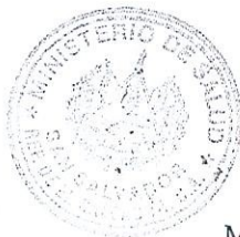
MARIA ISABEL RODRIGUEZ MINISTRA