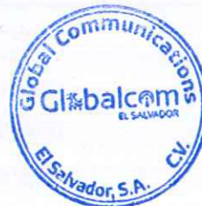
IMMER ALFARO CLÍMACO GLOBAL COMMUNICATIONS EL SALVADOR, S.A. DE C.V. POR "EL CONTRATISTA"