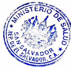
Ana del Carmen Orellana Bendek Ministra de Salud