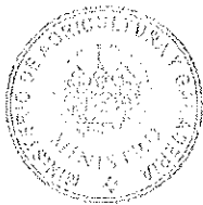
Pablo Salvador Anliker Infante Ministro de Agricultura y Ganadería