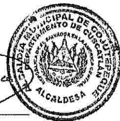
Mercedes Lili Belto de Perdomo Alcalde Municipal de Cojutepeque