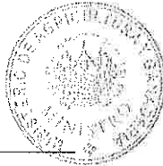
Pablo Salvador Anliker Infante Ministro de Agricultura y Ganadería