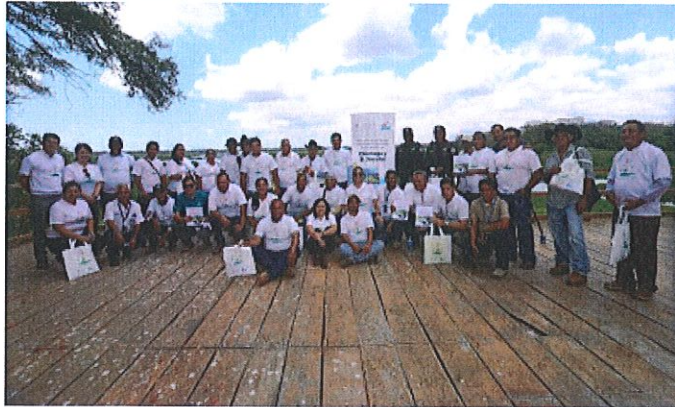
Figura 1. Celebración del día mundial de los humedales y entrega del plan de manejo del humedal Área Natural protegida Laguna del Jocotal, 20 de febrero de 2020.