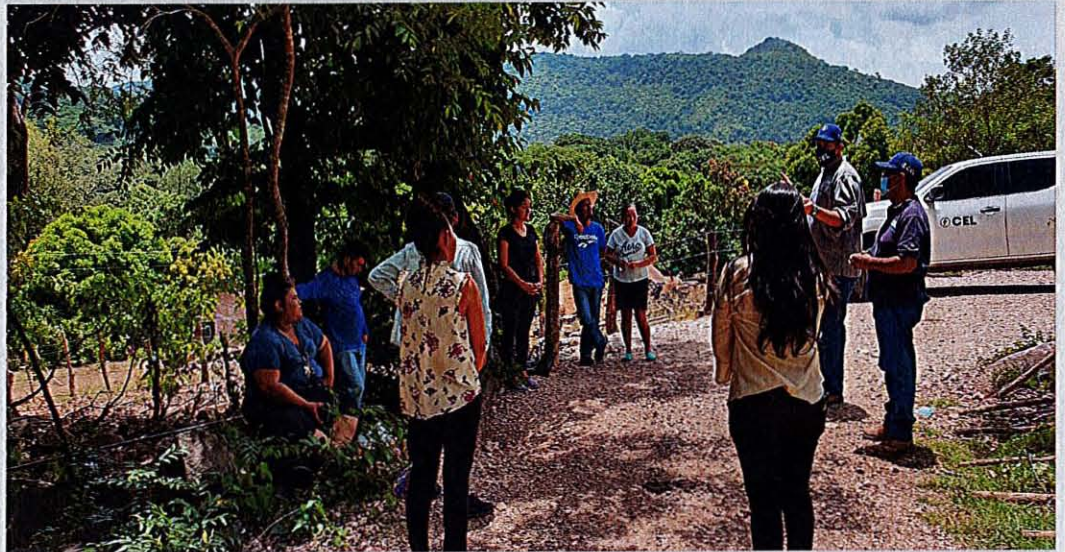
Foto 3: Reunión con las personas de la comunidad Guajoyito para solicitarles apoyo en la limpieza de la calle para la reconstrucción de la misma y solicitar su apoyo en el resguardo de la maquinaria.