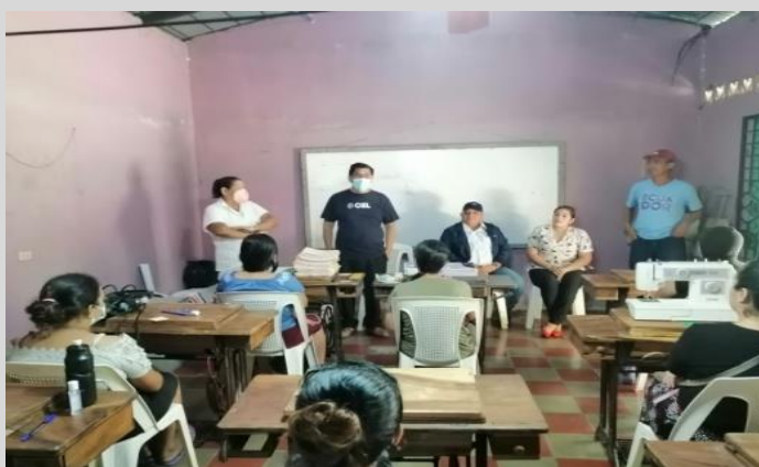
Fotografía 2: Asistencia técnica para el desarrollo económico y social en el área de influencia del proyecto Hidroeléctrico El Chaparral .