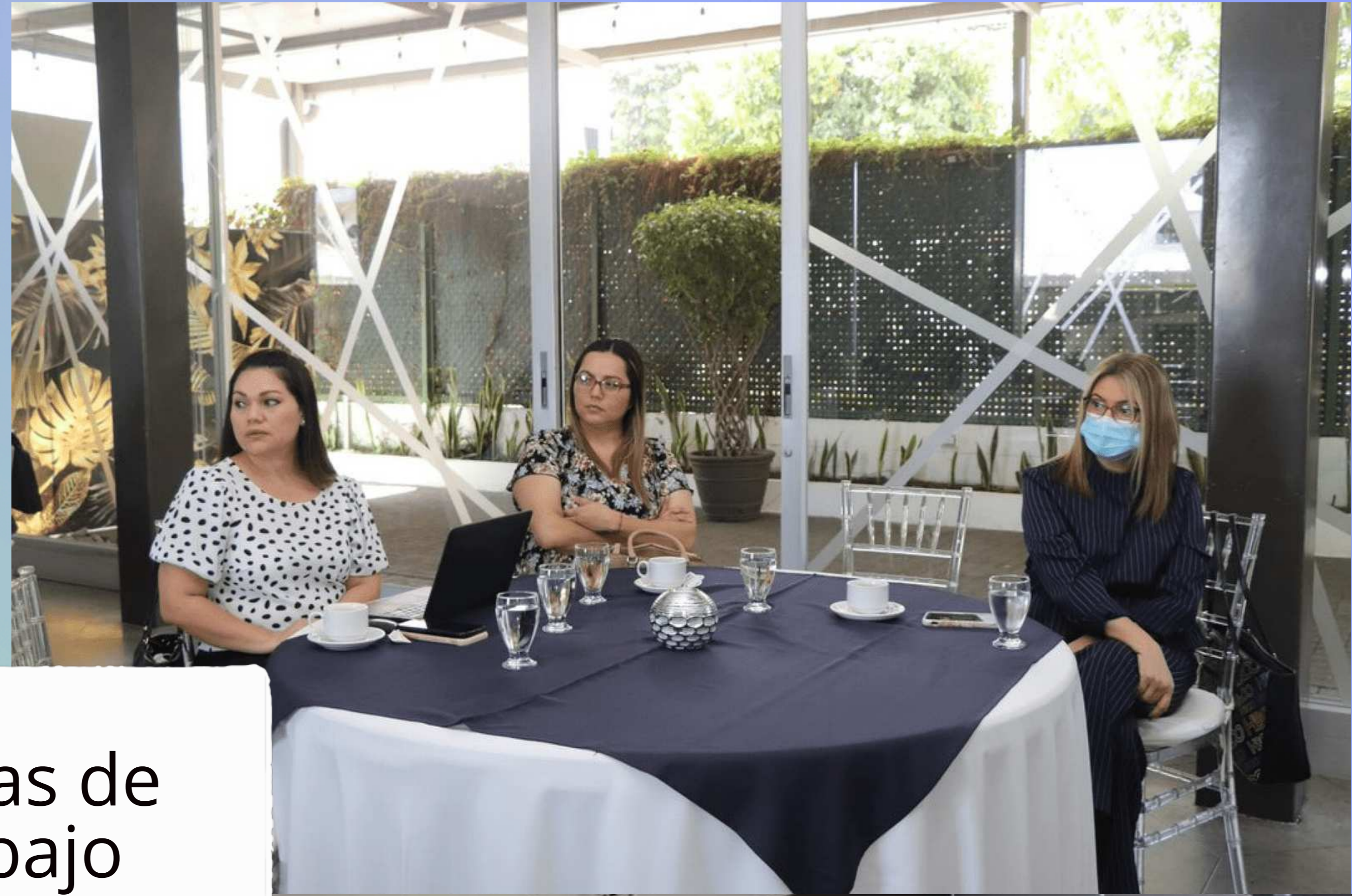
Mesas de trabajo