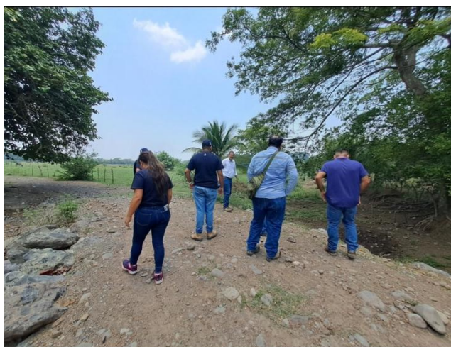
Imagen 2. Verificación de puntos donde intervendrá maquinaria para la limpieza de drenos.