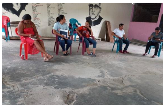
Imagen 3. Reunión con representantes ADESCO para coordinar acciones en beneficio de la comunidad Aguacaliente, Suchitoto, Cuscatlán