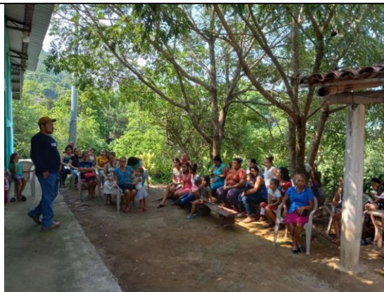
Imagen 2. Reunion con miembros de la comunidad para coordinar acciones en beneficio de la comunidad Trinidad de Sensuntepeque, Cabañas.