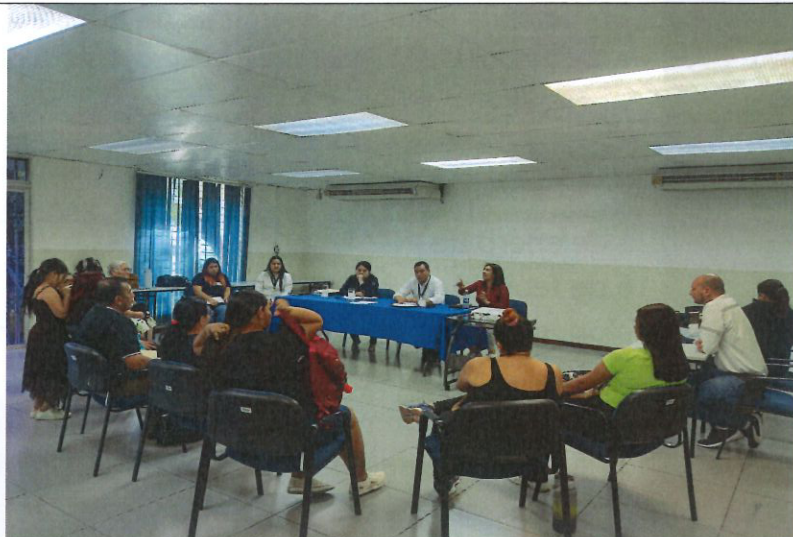
Imagen 2. Reunión con miembros de la ADESCO de la comunidad El Progreso 2 (16 de febrero de 2024, Salón de Usos Múltiples de Almacén Central de San Ramón).