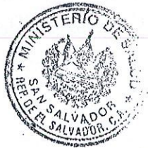
MARIA ISABEL RODRIGUEZ MINISTRA