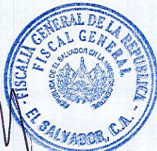
[Handwritten signature] LUIS ANTONIO MARTINEZ GONZALEZ FISCAL GENERAL DE LA REPUBLICA

República de El Salvador cuya aplicación será de conformidad con lo establecido en el Tratado de Libre Comercio de Estados Unidos de América - Centroamérica - República Dominicana (TLC-DR-CAFTA); La Ley de Adquisiciones y Contrataciones de la Administración Pública, su Reglamento y demás legislación salvadoreña aplicable. Asimismo señalamos como domicilio especial el de esta ciudad. CLÁUSULA DÉCIMA SEXTA: NOTIFICACIONES. Las notificaciones entre las partes se harán por escrito y tendrán efecto a partir de la fecha de su recepción en las direcciones que a continuación se indican: EL MINSAL en: Calle Arce Número Ochocientos Veintisiete, San Salvador, y LA CONTRATISTA en: Urbanización Satélite, Avenida Bernal, Block "F", número once, San Salvador. Tel.2274-1640, Fax. 25049059. En fe de lo cual firmamos el presente Contrato, en San Salvador, a los seis días del mes de febrero de dos mil catorce.