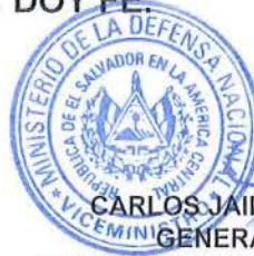
CARLOS JAIME MENA TORRES GENERAL DE AVIACIÓN VICEMINISTRO DE LA DEFENSA NACIONAL