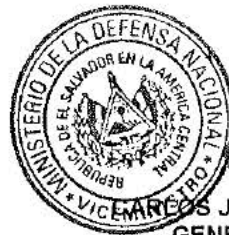
CARLOS JAIME MENA TORRES GENERAL DE AVIACIÓN VICEMINISTRO DE LA DEFENSA NACIONAL