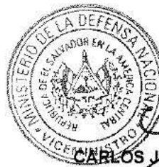
CARLOS JAIME MENA TORRES GENERAL DE AVIACIÓN VICEMINISTRO DE LA DEFENSA NACIONAL