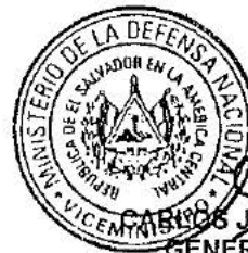
CARLOS JAIME MENA TORRES GENERAL DE AVIACION VICEMINISTRO DE LA DEFENSA NACIONAL