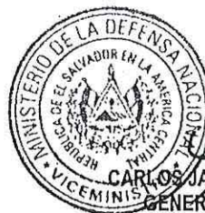
CARLOS JAIME MENA TORRES GENERAL DE AVIACIÓN VICEMINISTRO DE LA DEFENSA NACIONAL