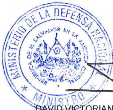
DAVID VICTORIANO MUNGUÍA PAYÉS GENERAL DE DIVISIÓN MINISTRO DE LA DEFENSA NACIONAL

RELACAP, Tratado de Libre Comercio entre República Dominicana-Centro América y Estados Unidos de América, la Constitución de la República, y en forma subsidiaria a las Leyes de la República de El Salvador, aplicables a este contrato. XVII) NOTIFICACIONES Y COMUNICACIONES: el "CONTRATANTE": Ministerio de la Defensa Nacional Kilómetro 5½, Carretera a Santa Tecla, Dirección de Adquisiciones y Contrataciones Institucional, Teléfono 2250-0100 extensión 1135 y el "CONTRATISTA": 55 Avenida Sur, Número 153, entre Alameda Roosevelt y Avenida Olímpica, San Salvador, Teléfonos 2298-0948, 2298-0944, 2298-0946 y 2224-3161. Todas las comunicaciones o notificaciones referentes a la ejecución de este contrato serán válidas solamente cuando sean hechas por escrito en las direcciones que las partes han señalado. En fe de lo cual suscribimos el presente contrato, en la ciudad de San Salvador, departamento de San Salvador, a los trece días del mes de febrero del año dos mil diecinueve.