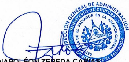
LIC. JOSÉ NAPOLEÓN ZEPEDA CARIAS DIRECTOR GENERAL DE ADMINISTRACIÓN MINISTERIO DE CULTURA