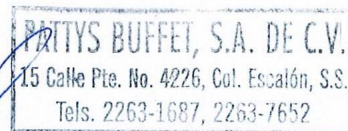
PATTYS BUFFET, S.A. DE C.V. SUMINISTRANTE