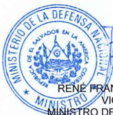
RENE FRANCIS MERINO MONROY VICEALMIRANTE MINISTRO DE LA DEFENSA NACIONAL

relacionadas, por haber sido puestas ante mi presencia por los comparecientes, a quienes impuse de los efectos legales de la presente acta notarial que consta de tres hojas útiles que comienzan al pie del documento que se autentica, y leída que les hube íntegramente lo escrito en un sólo acto, manifestaron su conformidad, ratificaron el contenido y para constancia juntos firmamos. DOY FE.