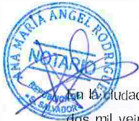
REPRESENTANTE LEGAL LA SOCIEDAD OTTOBOCK DE MÉXICO, S.A. DE C.V.