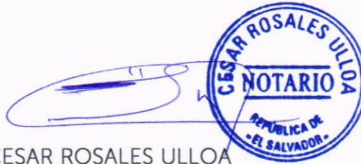
CESAR ROSALES ULLOA Notario.