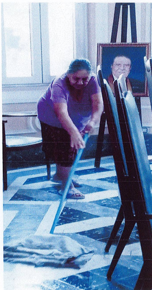
Limpieza del primer nivel

Meta 1. Actividad 2: Contratar los servicios profesionales de una encargada de limpieza para el mantenimiento de la Academia Salvadoreña de la Lengua y de la biblioteca especializada.