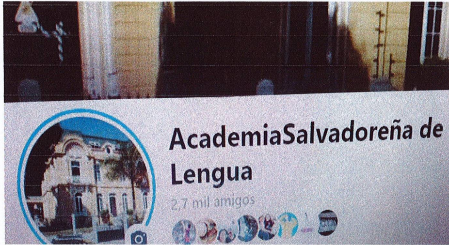
Un perfil en redes sociales de la Academia