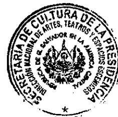
MARTA ELENA ROSALES PINEDA DIRECTORA NACIONAL DE ARTES, TEATRO Y ESPACIOS ESCÉNICOS